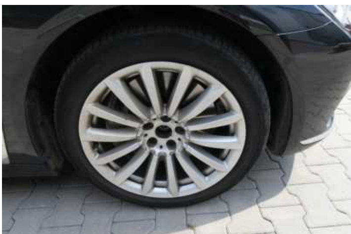
Fot. nr 78