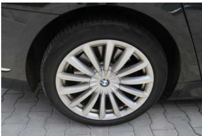
Fot. nr 76