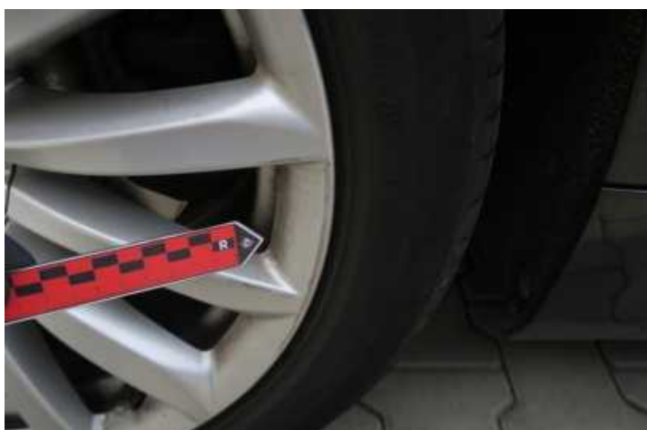
Fot. nr 77