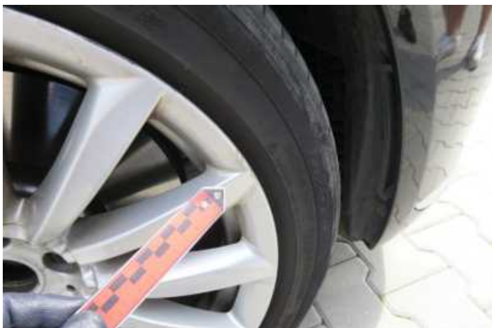
Fot. nr 80