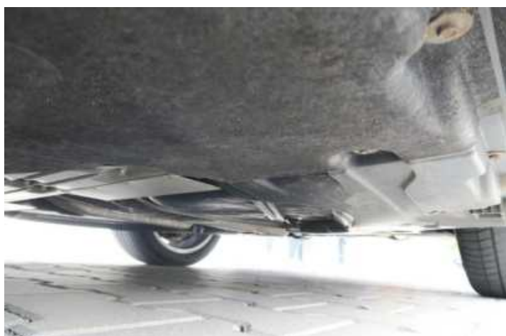
Fot. nr 71