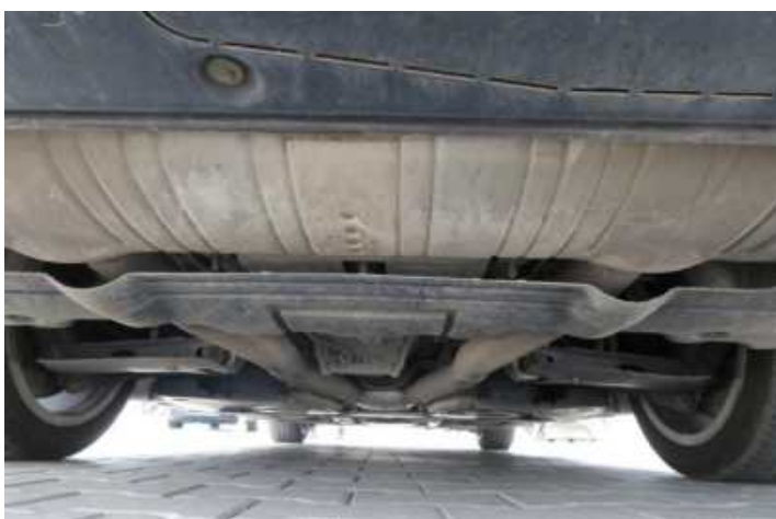
Fot. nr 72