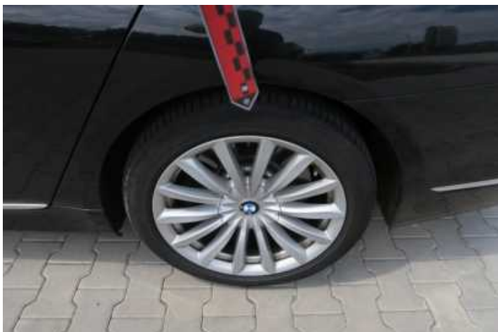
Fot. nr 74