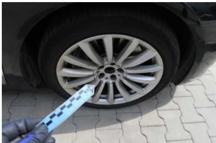
Fot. nr 79