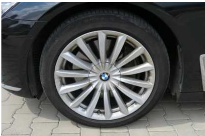
Fot. nr 73