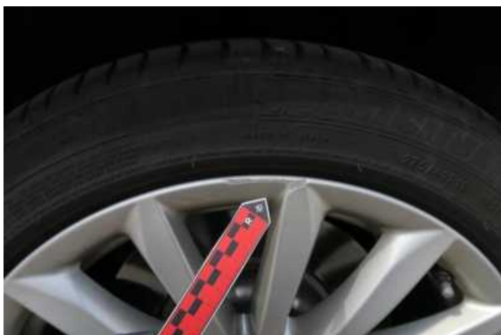
Fot. nr 75